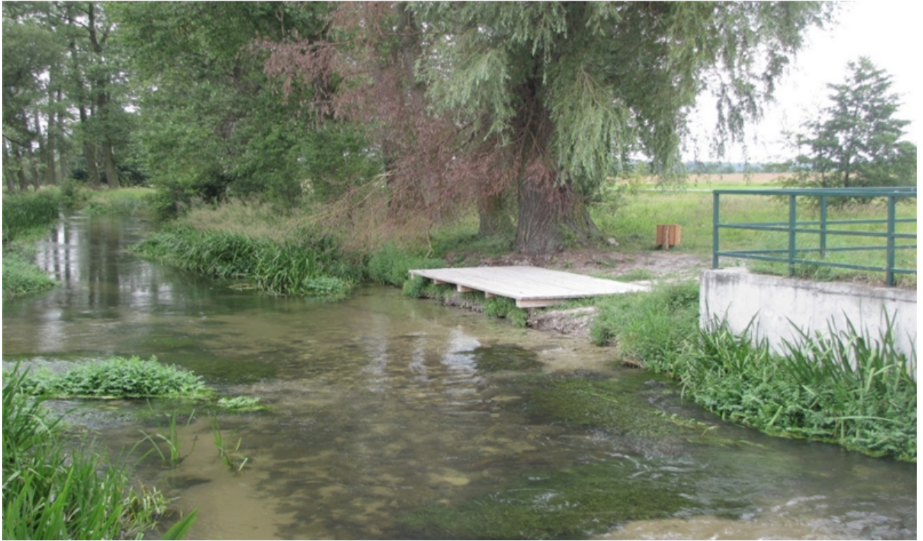
Fot. 1. Rzeka Wiercica