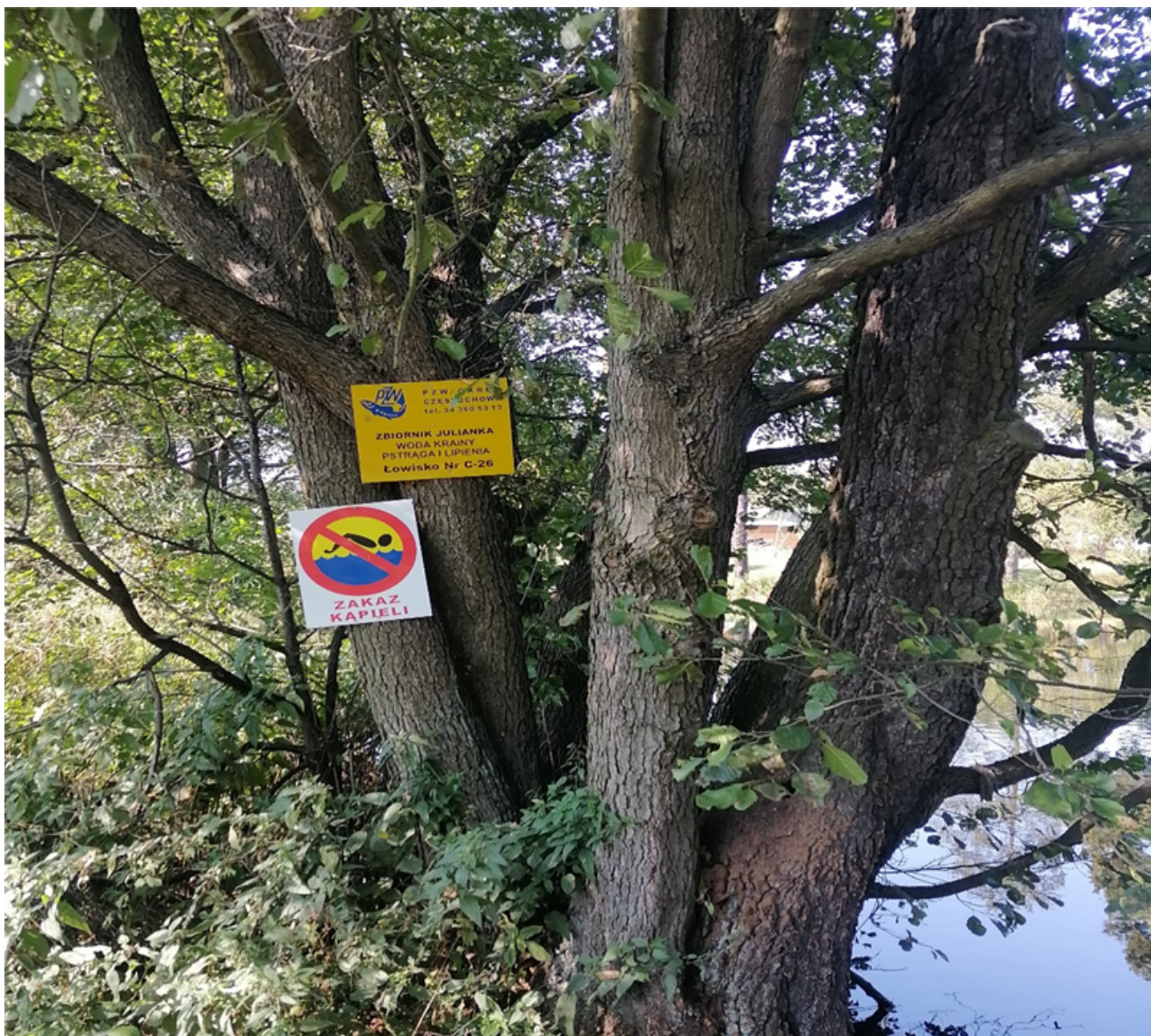
Fot. 4. Oznakowanie przy zbiorniku wodnym „Julianka” w miejscowości Zalesice