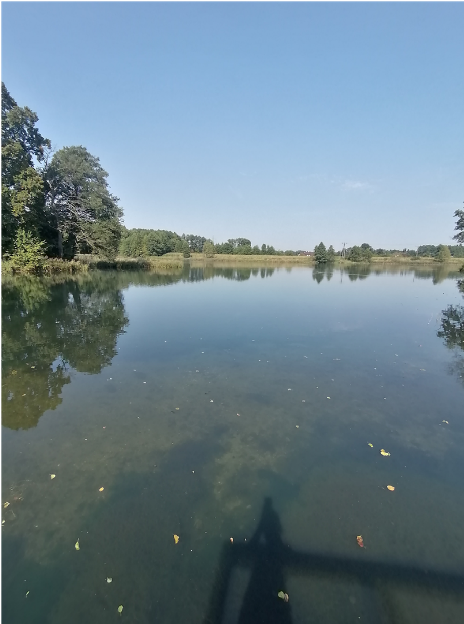
Fot. 3. Zbiornik wodny „Julianka” w miejscowości Zalesice

Zbiornik wodny zajmujący powierzchnię około 7 ha. Posiada nieregularną linię brzegową, która porośnięta jest trzcina przez co jest trudno dostępna dla ludzi. Na zbiorniku istnieje możliwość obejrzenia z pomostu widokowego unikatowych tzw. „Niebieskich Źródeł” oraz możliwość wypoczynku w usytuowanych przy pomoście widokowym altanach. Jest typowym miejscem wykorzystywanym do połowu ryb. Przy zbiorniku wodnym nie stwierdzono występowania „dzikich plaż”. Zbiornik oznakowany znakiem A 1 „zakaz kąpieli”.