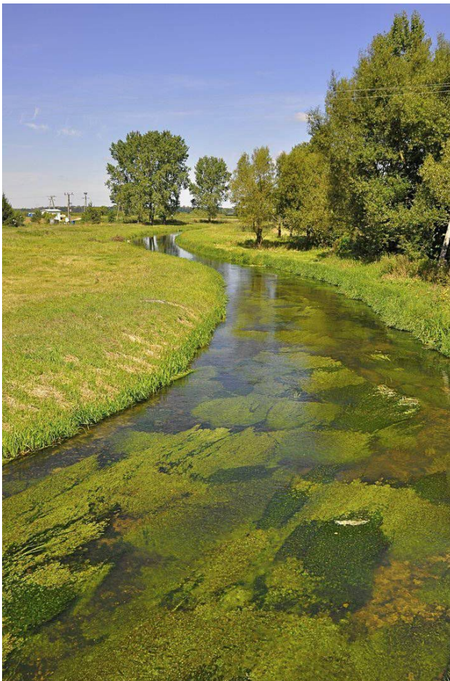
Fot. 2. Rzeka Wiercica