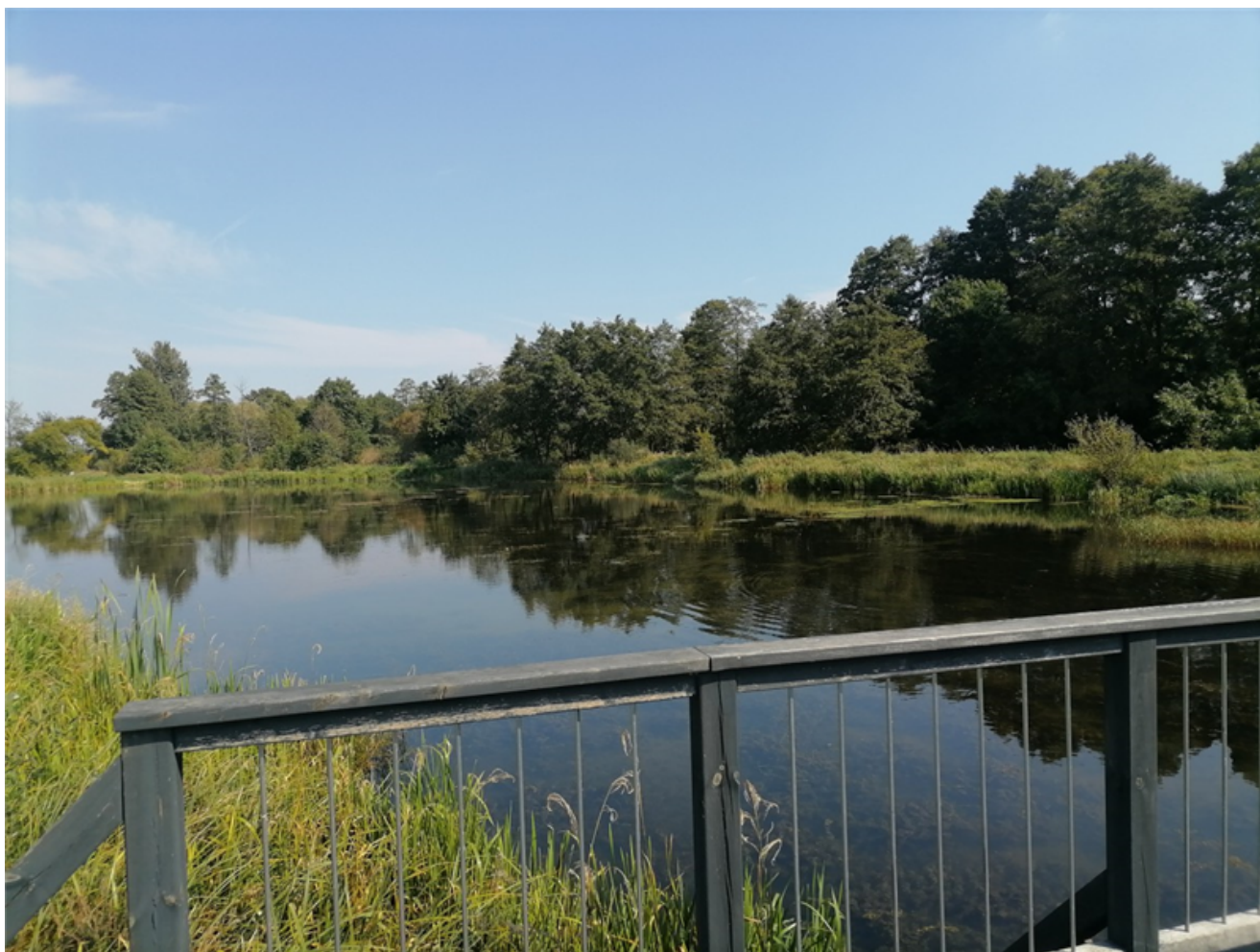
Fot. 5. Zbiornik retencyjny przy terenie rekreacyjnym w Przyrowie

Teren jest oznakowany odpowiednim znakiem zakazu.