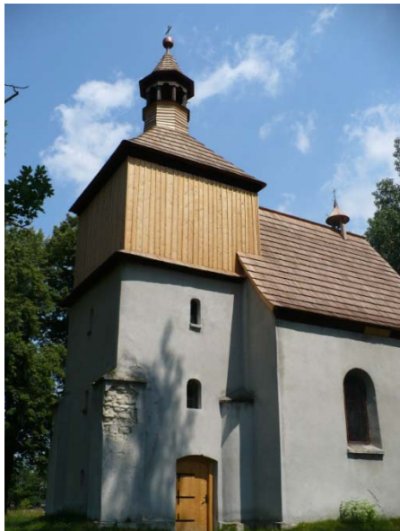
Kościół Św. Mikołaja po renowacji dachu.